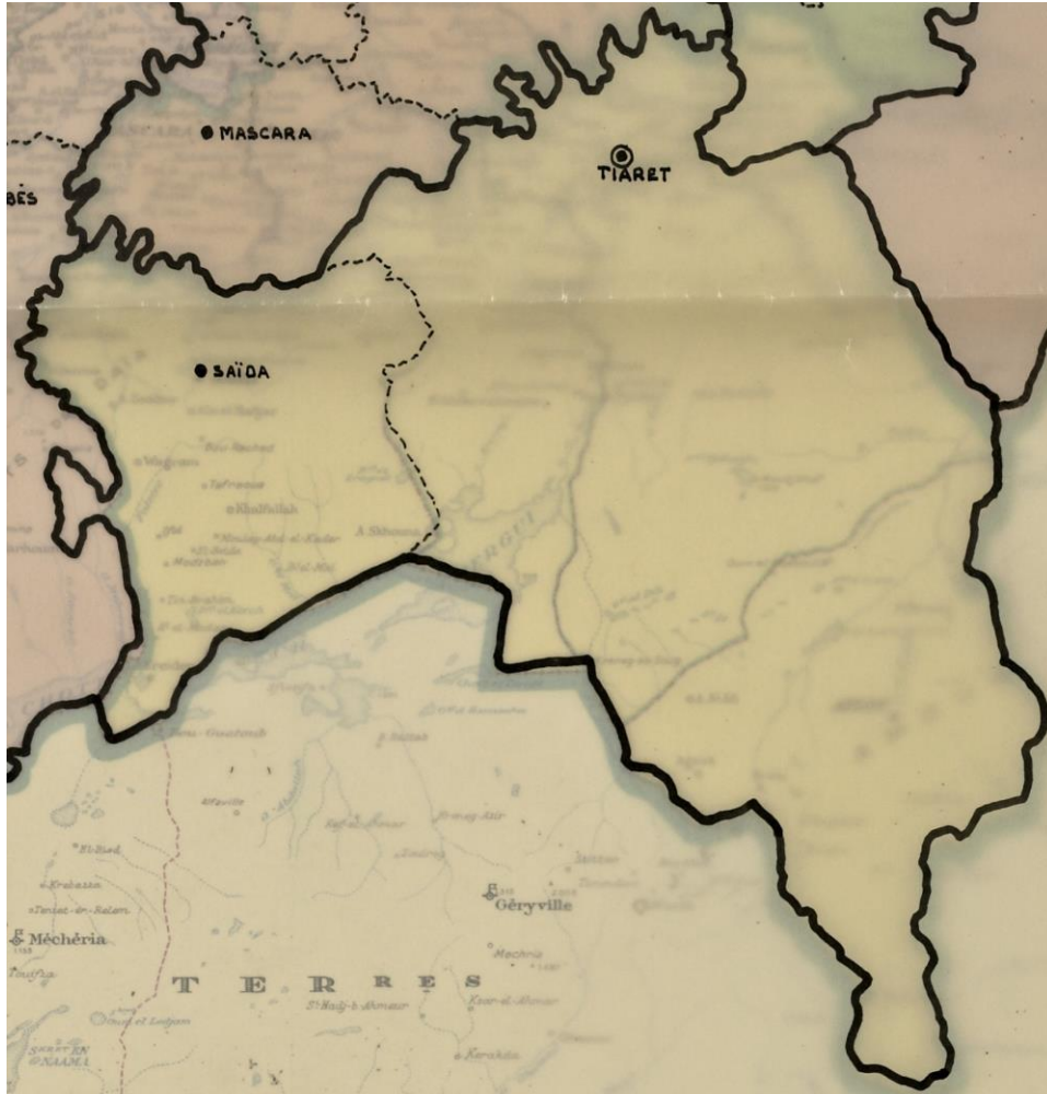
CARTE N°1 : DÉPARTEMENT DE TIARET EN 1956.

Toutes les cartes sont extraites du fonds GGA 3 R en cours de classement.